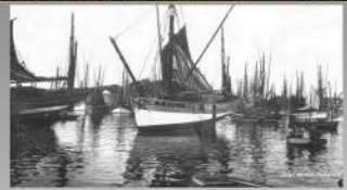
Mirage L 2501 ex L 5 755 Premier duré à avoir été un poste TSFophone en 1934 pour les communications avec une concorde des Bâtes d'Océan.