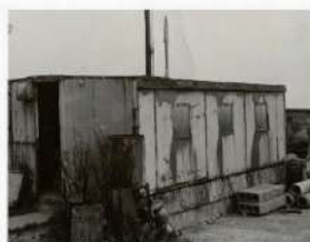
Figure 3 Le shelter où est installée la réception dès 1948. Sur le toit, de profil, l'ancienne antenne de radiogoniométrie.

Mais les ingénieurs des Postes, Télégraphes et Téléphones cherchent un site favorable à l'installation d'une station moderne. Ils retiennent celui de la Pointe des Renards sur la commune du Conquet à 25 kilomètres de Brest, site déjà exploité dans le passé pour les messages optiques du télégraphe Chappe, la signalisation par pavillons au Premier Empire et le poste électro-sémaphorique de 1861 à 1881.