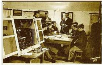
Œuvre des Ateliers-Maison, reconnue d'Utilité Publique Le Cours élémentaire d'Électricité et de T. S. F., à l'Abri du Marin de Gouesnou