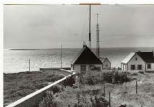
Figure 5 Le nouveau centre de radio Conquet.

Il assure également la « vacation pêche » qui permet deux fois par jour aux familles de savoir où sont les navires, quelle est leur activité et leur date de retour. L'écoute se fait sur le poste de TSF familial. En 1995, le centre compte 350 navires de pêche abonnés.