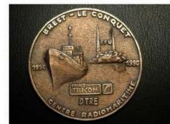
Figure 9. Médaille.