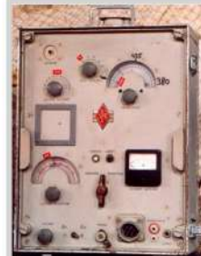
Station BREST Le Conquet Radio Septembre 1952, brochure 28 Fév 2000