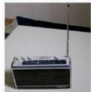
Figure 7 Un transistor "bande marine".

Le 1 er janvier 1982, en application d'un accord international, les fréquences doivent laisser la place à la BLU (bande latérale unique) qui devient obligatoire. Les communications ne peuvent plus être écoutées sur un simple poste radio et les familles doivent s'équiper de nouveaux appareils.