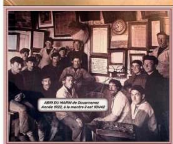
Atelier du Marin de Gouesnou Année 1952, à la fin de l'été 1952