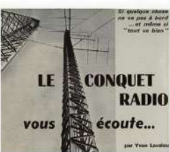
Figure 2 Un article sur radio Conquet.

Privées, puis organismes d'Etat, des stations radio sont établies sur tout le littoral français et étranger.